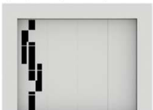
HADES : 364 €