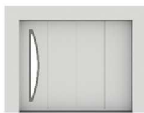
OPALE : 902 €