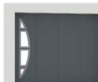
HIRIS : 1 327 €