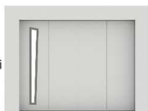
CRONOS : 926 €